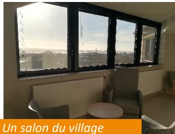
Un salon du village Belle Ile (4 ème étage)

Cette étape marque la fin de la quatrième phase du plan directeur architectural débuté en 2014. Il s'agit de la dernière phase de travaux concernant les locaux d'hébergement des résidents. Tous les résidents de l'établissement disposent désormais de locaux neufs ou rénovés, adaptés à leurs besoins.