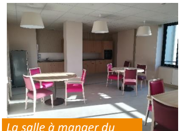
La salle à manger du village Molène (1 er étage)